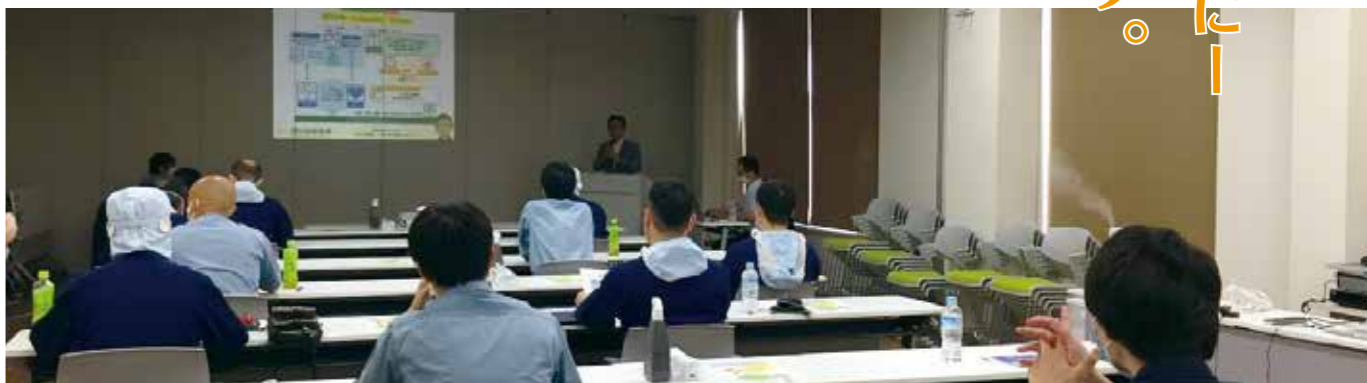
新型コロナウイルス感染予防対策として、人数を絞って行われた経営方針発表会の様子 2020年6月27日

新型コロナウイルスで、ガラッと時代が変わろうとしています。激動する時だからこそ「つながる経営、常に考え試行しよう」をスローガンにお客様と共に成長していきたいと思えます。