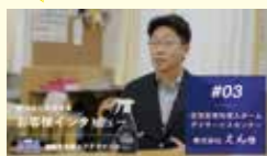
▲お客さまインタビュー「株式会社えん」様にお話を伺いました。