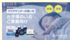
▲お子様のいるご家庭向けアクアサニターの使い方をご紹介します。

鮮度保持やアクアサニターの使い方など、こんな動画があると助かる。などございましたら、ご要望をお寄せください。