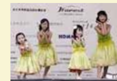
▲右から2番目が長女です

1年程前からフラダンスを習い始めた 5歳の長女。コロナ禍で人前で踊る機 会がなく……。8月のイベントのス テージでやっと初めて踊ることができ ました！普段と違う娘の姿に成長を感 じ、父は涙が出る思いでした（涙）